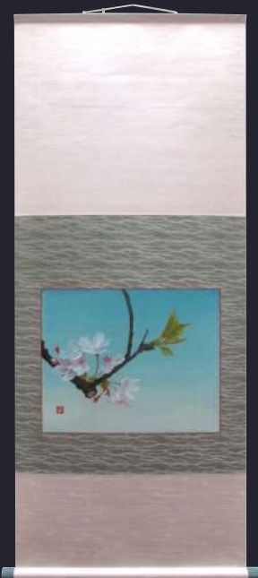
第69回 軸装の部 大阪府知事賞

伝統表具から、新しい素材を駆使して 現代風にデザインした創作表具まで、 幅広い表具のあり方をご堪能いただければ幸いです。 今回も大阪芸術大学の協力を頂き、美術学科学生の作品を 表具して展示します。