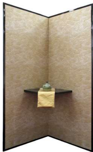
屏風「棚付き唐紙屏風」 紙戸屋・中野表具店（大阪市） 中野泰仁